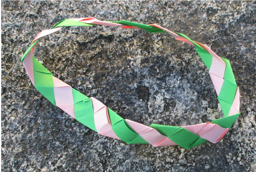
Abb. 2: Geflochtenes Möbius-Band

Die Abbildung 2 zeigt das geflochtene Möbius-Band. Es ist durchgehend konsistent geflochten.